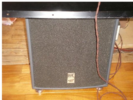
ドイツ製のウーファ HK(Crown 75A で駆動された。)