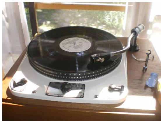
ターンテーブル: ガラード 401 カートリッジ: オルトフォン Aタイプ アーム: オルトフォン ロングタイプ

ラックには最上段にLPプレーヤー 次の段に金田式プリアンプと電源、ミキサー234XL その下の段にツイーター用のパワーアンプ2台 最下段にスクーナー用のパワーアンプ2台 ウファー用は CROWN 75A が使用された。