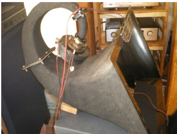
ツイターもスクーカーも音声ケーブルとは別に電磁石用に DC 9V を印加している。