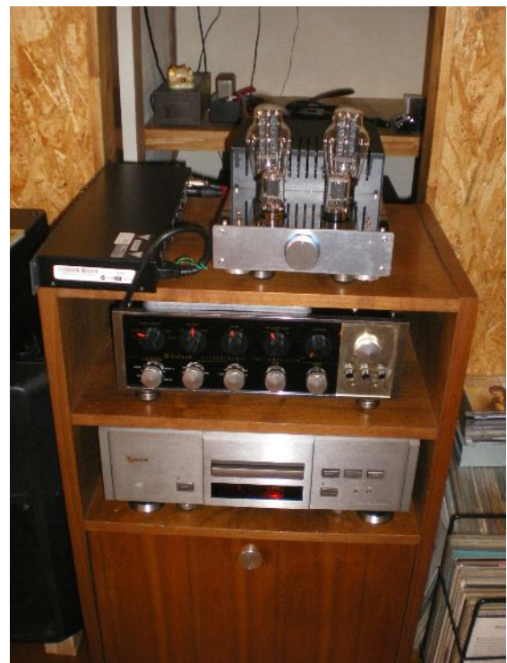
ラック上段が 300B を搭載したパワーアンプ その下がマッキントッシュ C-20 とカセットデッキ

普段、鑑賞会で試聴しているアルバムで再生しました。特に1. と2. のバイオリンの音は非常によく鳴っていました。また関井さんよりチェット・ベイカーのアルバムが非常に盛り上がりの良い音でした。特に LP の方がよく鳴っているように感じました。